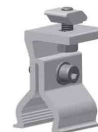
屋顶夹具组件 Roof Clamp Kit

节省安装材料 The mounting system materials are saved