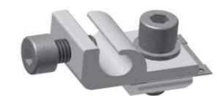
接地耳组件 Ground-lug Kit