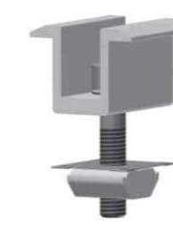
中压块组件 Mid-Clamp Kit