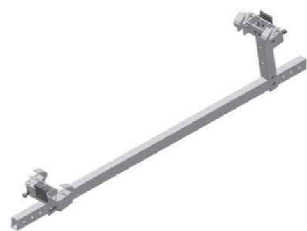
支架模块 Bracket Module

节省安装材料 The mounting system materials are saved