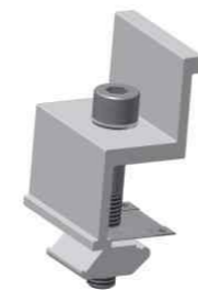
边压块组件 End-Clamp Kit