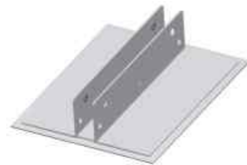
支撑脚 Foot Assembly