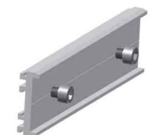
导轨连接件组件 Rail Splice Kit