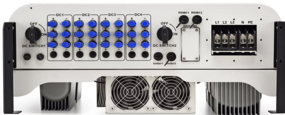
SUN-30K-G02-LV OU ELGIN30KW

A ELGIN reserva o direito de atualizar ou corrigir possíveis erros de seus informativos técnicos sem aviso prévio.