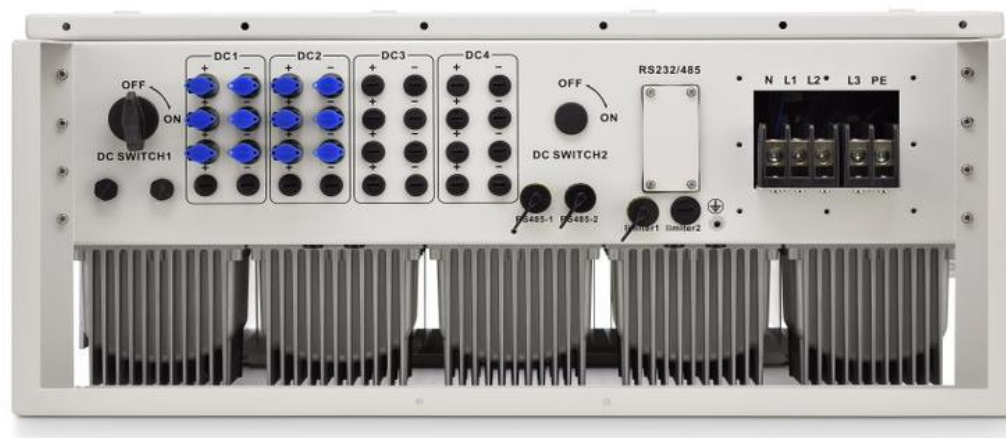
SUN-15K-G02-LV OU ELGIN15KW

A ELGIN reserva o direito de atualizar ou corrigir possíveis erros de seus informativos técnicos sem aviso prévio.